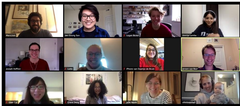
Digitale lab foto ↑

Mijn verwachting van de hoeveelheid kennis die ik dacht op te doen, is ver overstegen en heeft meer dan bijgedragen aan mijn ontwikkeling als onderzoeker. Ik heb mij tijdens dit avontuur op zowel academisch vlak als persoonlijk vlak verder ontwikkeld en dit gaat mij zeker verder helpen in mijn aspiraties. Ik zal dit avontuur altijd koesteren.